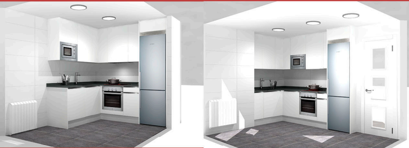
COCINA PLANTA BAJA