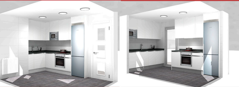
COCINA PLANTA SEGUNDA